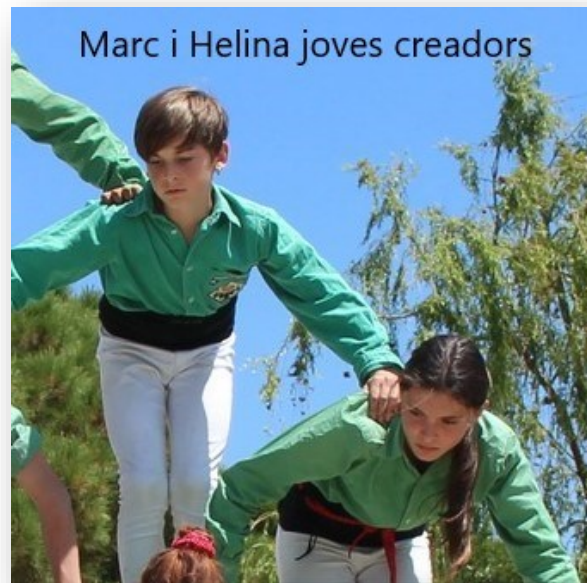
Homenatge a Pau CASALS a Prada

Deixeu-me que us digui una cosa... JO sóc català. Catalunya és avui una regió d'Espanya, però què ha estat Catalunya? Catalunya ha estat la nació més gran del món. Jo us n'explicaré el per què. Catalunya va tenir el primer Parlament, molt abans que Anglaterra. Catalunya va tenir les primeres Nacions Unides: al segle XI totes les autoritats de Catalunya es van reunir en una ciutat de França —aleshores Catalunya— per a parlar de pau, al segle XI... pau al món i contra, contra, contra les guerres, la inhumanitat de les guerres.... això és Catalunya.