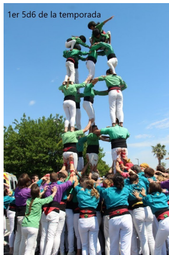
1er 5d6 de la temporada