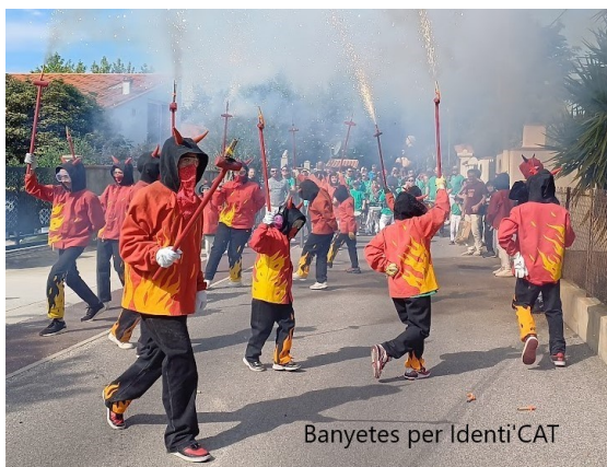
Banyetes per Identi'CAT