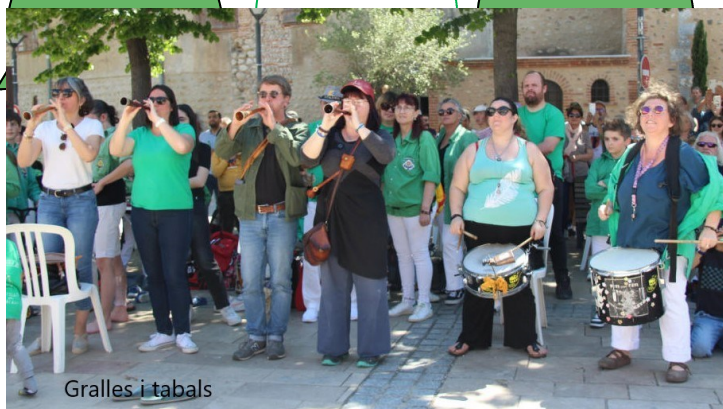
Gralles i tabals