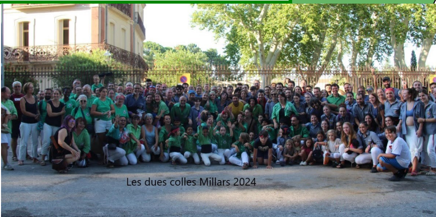
Les dues colles Millars 2024