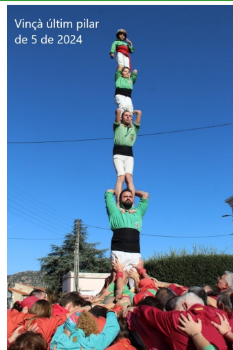
Vinçà últim pilar de 5 de 2024