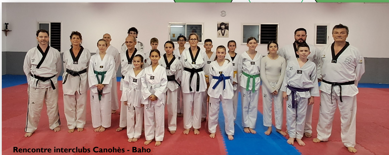
Rencontre interclubs Canohès - Baho

Un mois de décembre chargé d'activités :