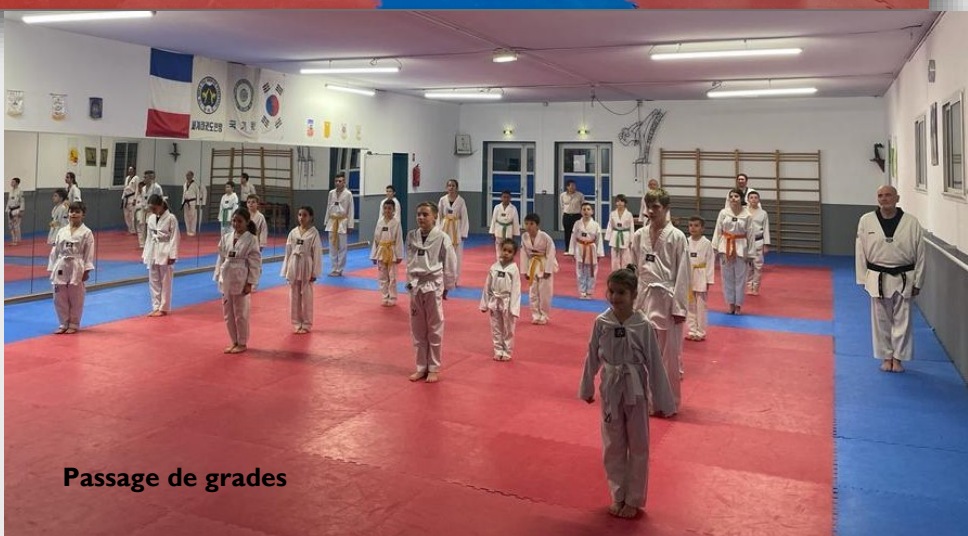
Passage de grades

Nous vous souhaitons de passer de bonnes fêtes de fin année.