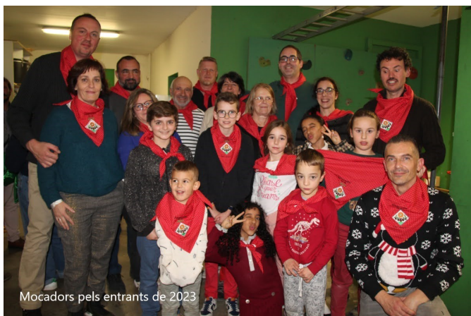
Mocadors pels entrants de 2023