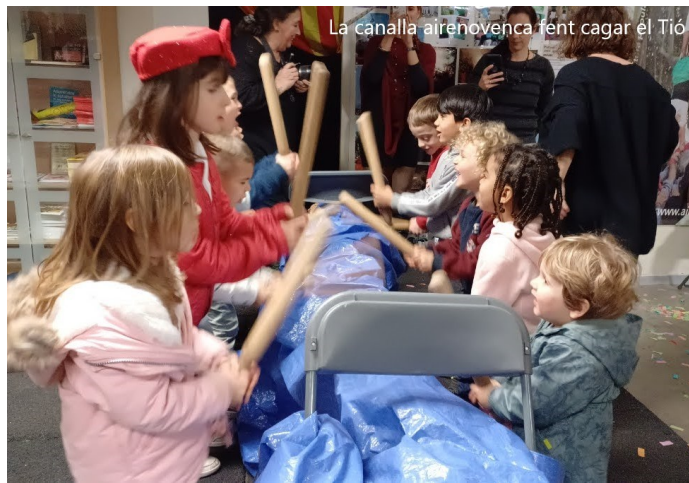
La canalla airenovenca fent cagar el Tió