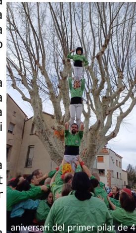
aniversari del primer pilar de 4