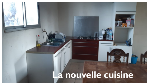
La nouvelle cuisine

Déjà, l'équipe du président s'est attaquée à l'aménagement de notre casot pour lequel un don de mobilier de cuisine vient de nous être fait. Les rangements, évier, cuisinière sont en place toujours avec l'aide de ces « professionnels » qui constituent l'équipe...Un plus autour de notre cheminée..