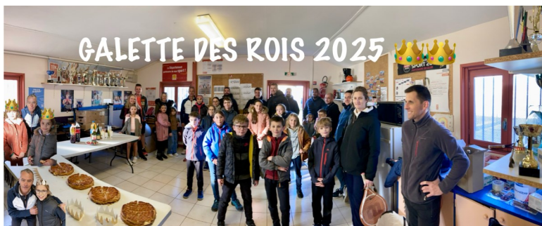
GALETTE DES ROIS 2025

La nouvelle année a bien démarré avec l'animation de la galette des rois !