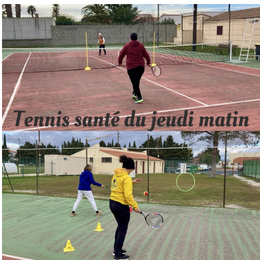
Tennis santé du jeudi matin

Le tournoi enfants en balles orange a eu lieu le 25/1, ils ont pu jouer dans le format de jeux des champions avec en récompenses un goûter et médaille. Bravo à tous !