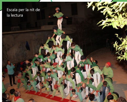
Escala per la nit de la lectura

Aire Nou de Bao, una entitat al servei de la llengua i la cultura catalanes