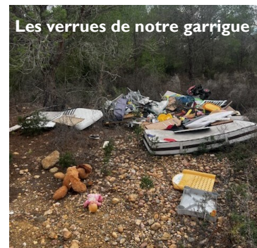
Les verrues de notre garrigue

Place maintenant, aux formations de la FDC, à l'entretien du matériel de tir, à l'observation de la nature, de la faune.....et aux aménagements.